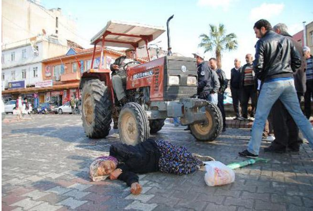
Fotoğraf 9: Sözcü Gazetesi, “Çarpıtı Yerinden Bile Kıvıldamadı”, 06.12.2012.

Aşağıda yer alan fotoğraf gerçekten insan onurunu zedeleyici bir haber fotoğrafıdır. Oysa şunu unutmamak gerekir ki hiçbir fotoğraf insan onurundan daha değerli değildir.