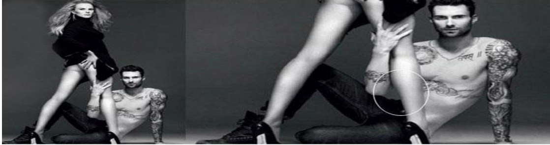
Fotoğraf 5: “Yok Böyle Photoshop Hatası”, Vogue Dergisi, Ekim 2011.

Magazin basınında yer alan ünlülerin fotoğraflarında gençleştirme, daha zayıf, daha kaslı gösterme gibi estetik nedenlerle photoshoplara sıkça başvurulmaktadır. Bu teknoloji sayesinde bizler yaşlanır ve şişmanlarken ünlüler hep genç, zayıf ve kaslı kalmaktadır. Fotoğraf editörleri masalarına gelen yayınlanacak fotoğrafın son halini çok iyi kontrol etmeli, bunca dijital olanaklara rağmen hatalı fotoğraflarla piyasaya çıkmak gerçekten büyük bir yanlış ve sorumsuzluktur.