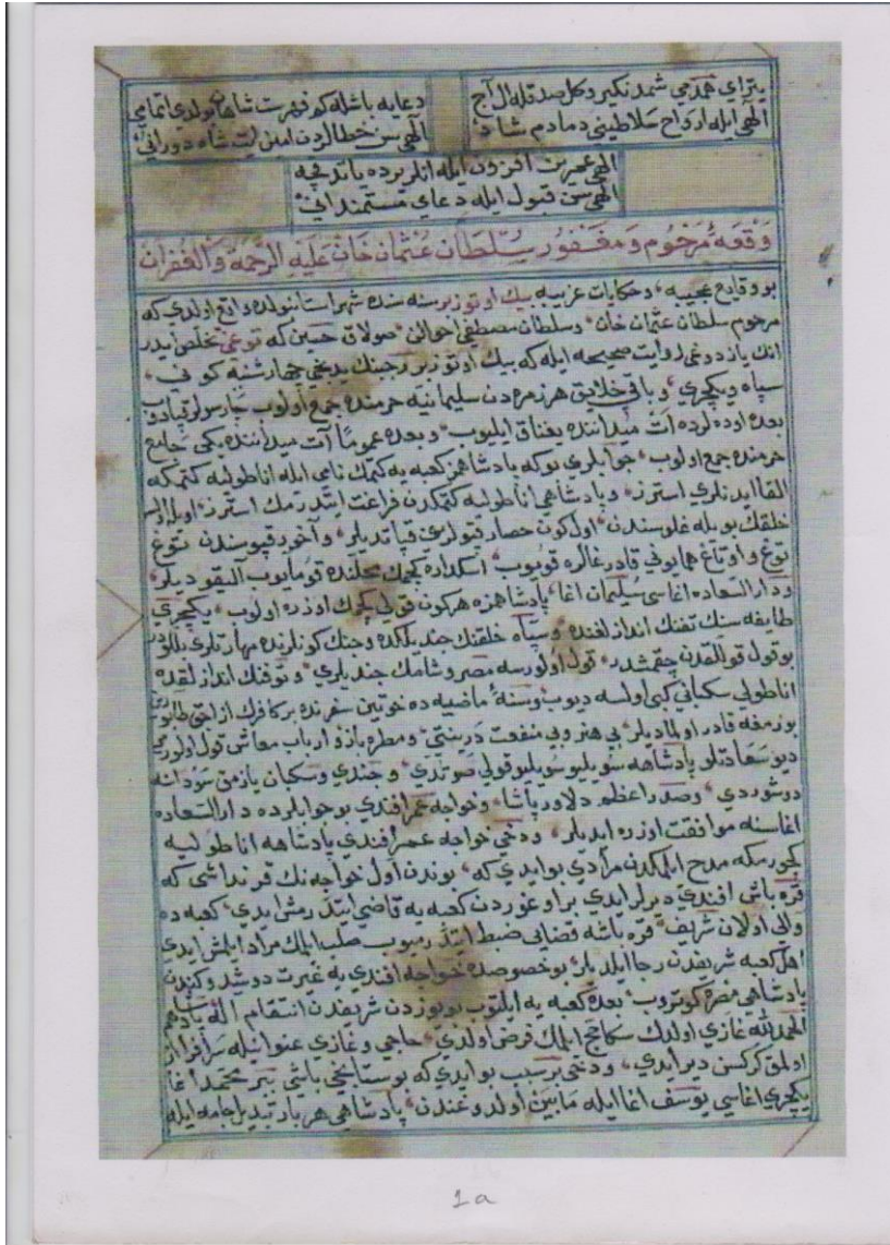
Yazma Nüshadan Bir Varak Örneği