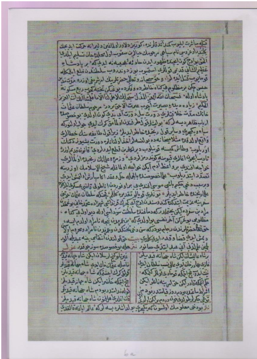
(6a) nolu varak